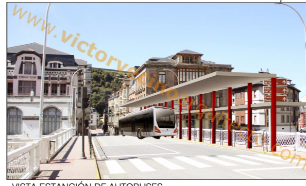
VISTA ESTACIÓN DE AUTOBUSES

PROPUESTA RESTRUCTURACIÓN URBANA DE LLUARCA (VALDÉS) ASTURIAS